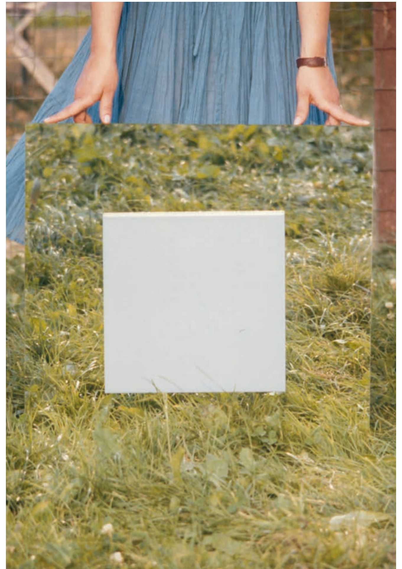
Ph. Charles Traub - Marazzi, 1980

RU Дома, здания, города - все они являются пустыми пространствами, без проживающих в них людей. Исходя из этого, вот уже более восьмидесяти лет Marazzi создает и производит керамические материалы, в которых прагматизм сочетается с красотой, новизна совершенствует традиции, а технология идет на службу людям. Рядом с эксклюзивными технологиями, прочностью и надежностью Marazzi стоят стиль, вкус, увлечение керамикой и любовь к красоте. Потому что там, где кончается дизайн, всегда начинаются эмоции.